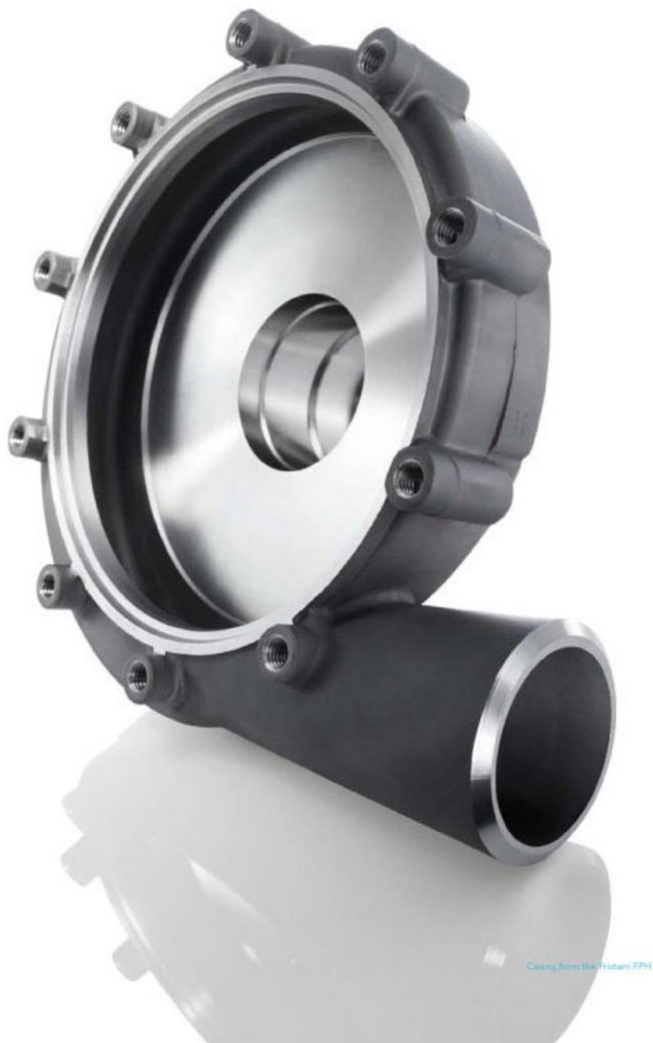
Casing from the Fristam FPH